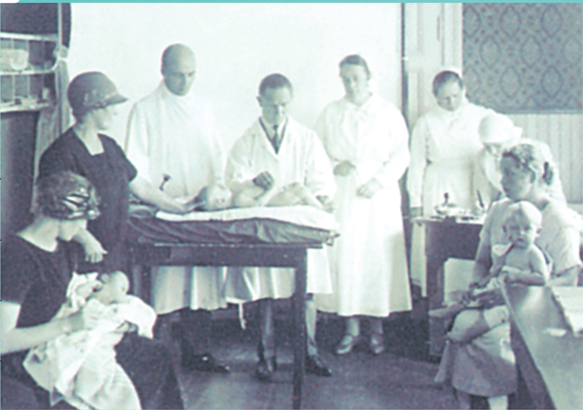
Kuva vuodelta 1927.

Rokotukset ovat kuuluneet suomalaisten perheiden ja neuvoloiden arkeen jo vuosikymmeniä. Kansallisen rokotusohjelman rokotukset ovat vapaaehtoisia ja maksuttomia.