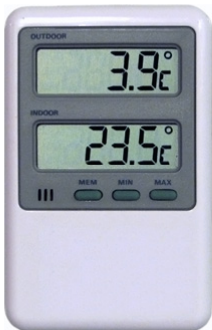
Kuva: Digitaalinen maksimi-minimi-lämpömittari.

Jokaisessa jääkaapissa kannattaa säilyttää rokotteiden yhteydessä myös lämpö- ja jäätymisindikaattoreita. Lämpöindikaattori on saapuneissa rokotelähetyksissä yleensä kiinnitetty yhteen rokotepakkaukseen. Indikaattori jätetään paikoilleen kylmäketjun tarkastamisen jälkeen, ja sen värin muutosta seurataan aina rokotteen käyttöön asti. Lämpöindikaattorilla varustettu rokotepakkaus pyritään käyttämään kyseisen rokotelähetyksen viimeisenä.