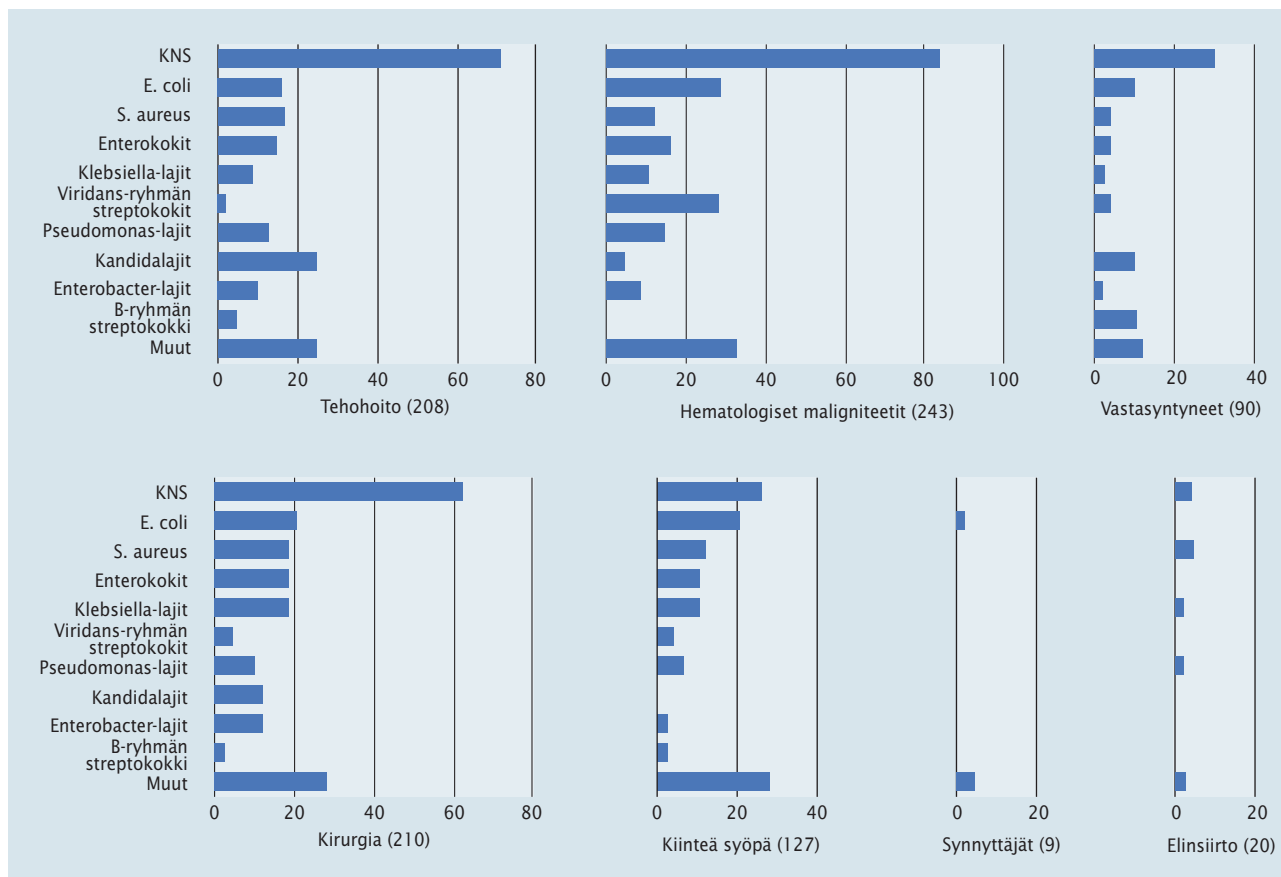
Kuva 1. Aiheuttajamikrobit eri potilasryhmissä. Sulkeissa mikrobilöydösten lukumäärä.

ennen infektion toteamista. Tehoosastolta pois siirtämisen jälkeen 2 vuorokauden kuluessa todetut infektiot luokiteltiin tehohoitoon liittyviksi. Potilaan katsottiin altistuneen kirurgiselle toimenpiteelle, mikäli hänet oli kirjattu leikkaussaliin sairaalahoitajakson aikana ennen infektion toteamista. Pelkkää keskusklinikamokatetrin laittoa tai poistoa leikkaussalissa ei katsottu kirurgiseksi toimenpiteeksi.